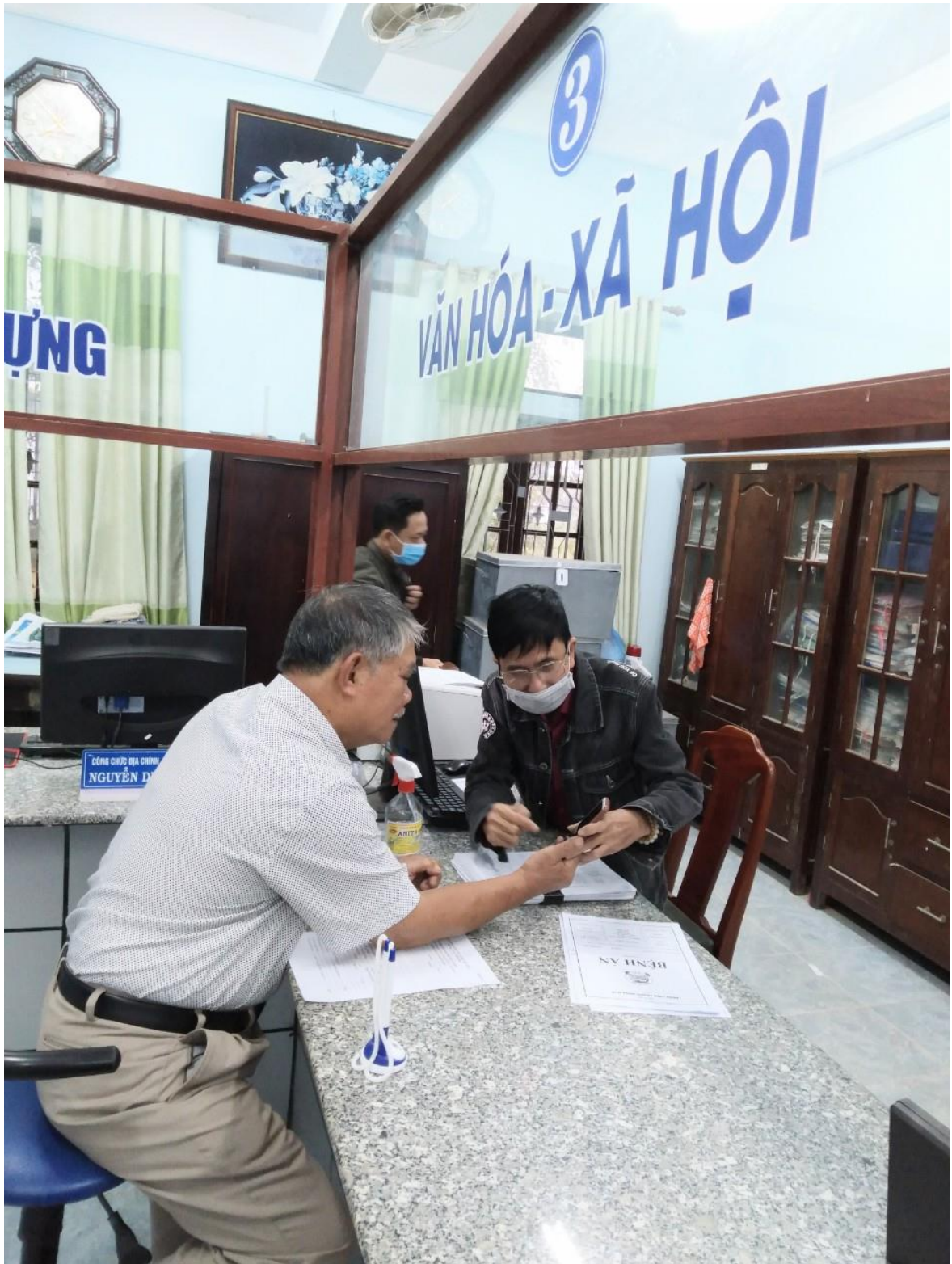
Hình ảnh: Hoạt động hỗ trợ người dân thực hiện nộp hồ sơ thủ tục hành chính thông qua hệ thống điện tử tại Bộ phận tiếp nhận và hoàn trả kết quả tại UBND phường Phú Hậu

Cùng với đó, Thực hiện nội dung Công văn số 7711/UBND-CNTT ngày 12 tháng 10 năm 2022 của UBND thành phố Huế về việc hướng dẫn, theo dõi, đôn đốc các cơ quan, đơn vị, UBND các phường, xã triển khai thực hiện khởi tạo ví điện tử trên Hue-S và ngày 12/10/2022 Phòng văn hóa thông tin thành phố Huế đã có công văn số 688/VHTT về việc triển khai giải pháp thúc đẩy thanh toán