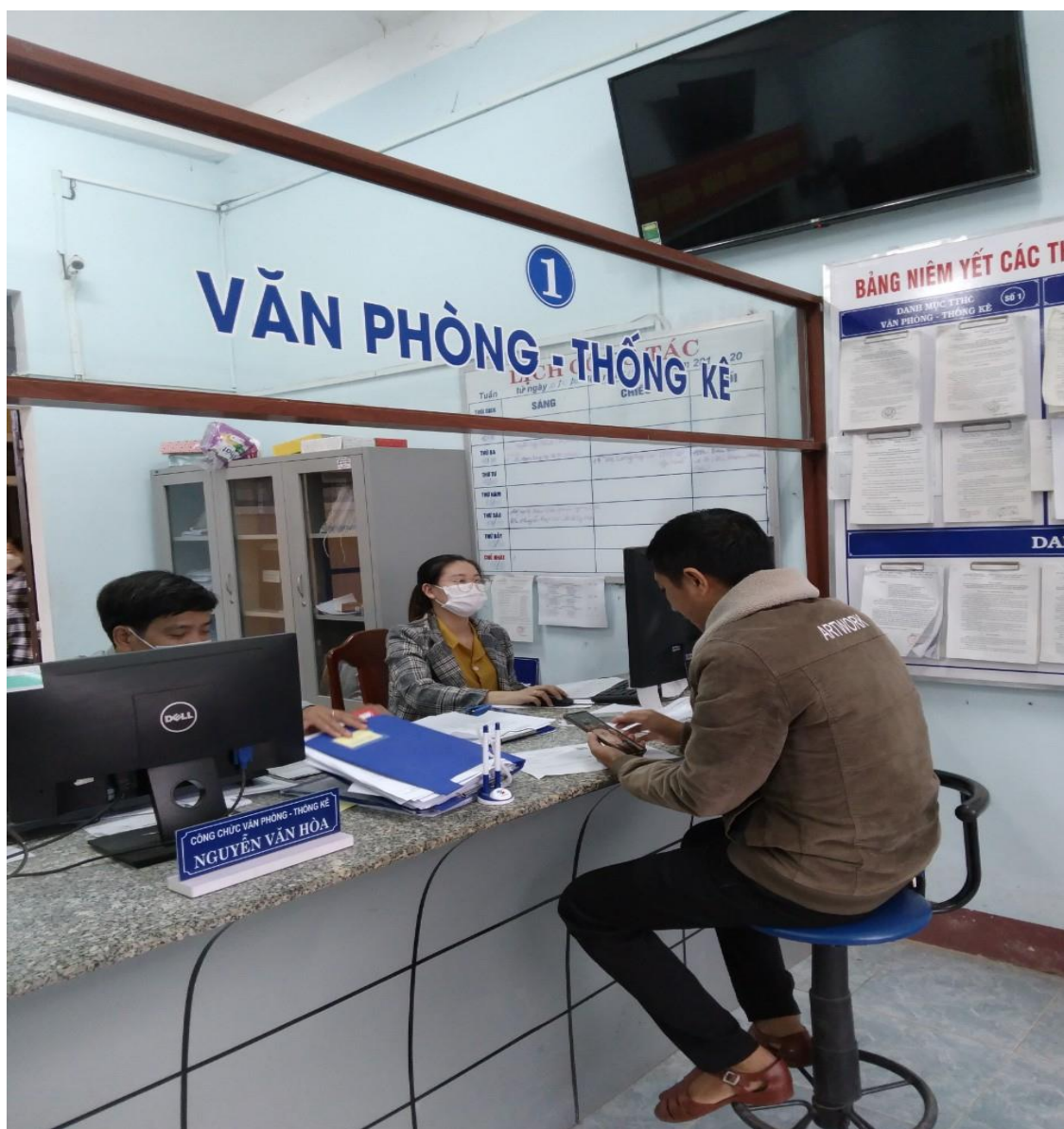
Hình ảnh: Hoạt động hỗ trợ người dân thực hiện chuyển đổi số giải quyết thủ tục hành chính tại Bộ phận tiếp nhận và hoàn trả kết quả UBND phường Phú Hậu

Các hoạt động hưởng ứng Ngày Chuyển đổi số quốc gia năm 2022 tập trung vào các hoạt động như: thực hiện các chương trình ký số hồ sơ công văn đi – đến tại cơ quan; các hợp đồng điện tử, nộp thuế, báo cáo thuế trực tuyến; đã sử dụng hóa đơn điện tử để thu phí, lệ phí công chứng, chứng thực tại cơ quan. Qua đó thúc đẩy phổ cập kỹ năng số cho người mới tiếp cận và mang lại lợi ích thiết thực cho người dân, cơ quan và doanh nghiệp khi đến thực hiện giao dịch thủ tục hành chính tại các cơ quan, đơn vị hành chính nhà nước.